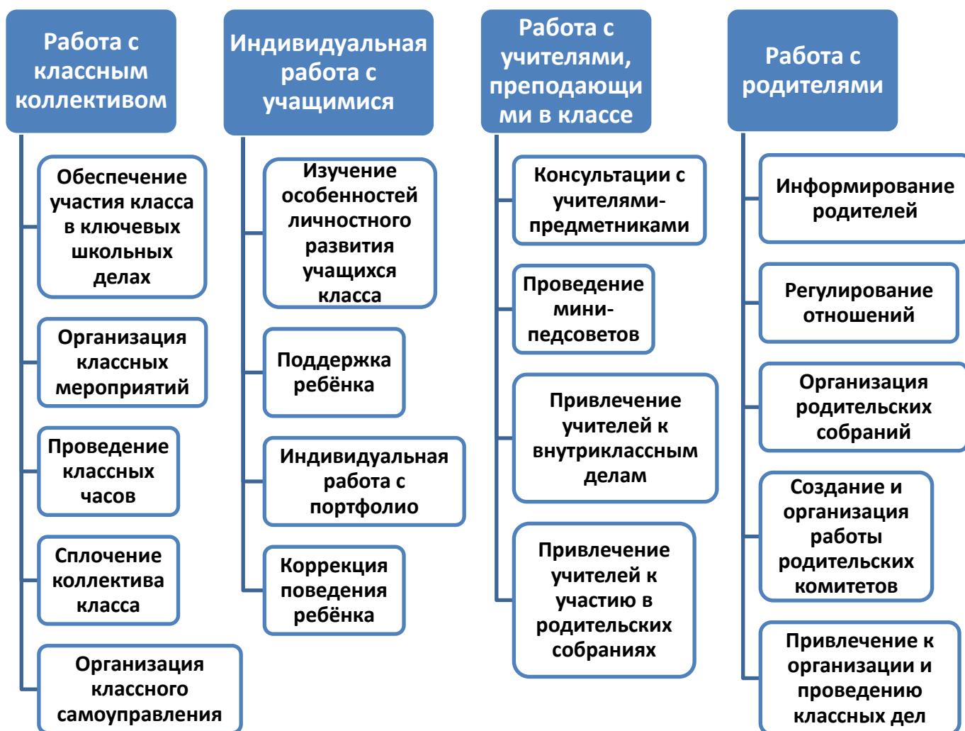
Схема 2. Классное руководство.

Осуществляя работу с классом, классный руководитель организует работу с коллективом класса; индивидуальную работу с учащимися вверенного ему класса; работу с учителями, преподающими в данном классе; работу с родителями учащихся или их законными представителями.