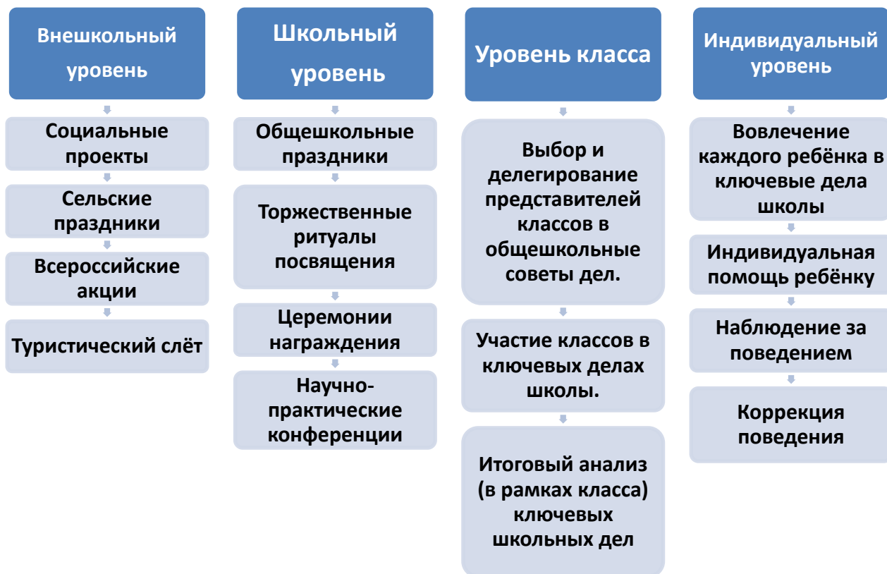
Схема 1. Школьные дела.