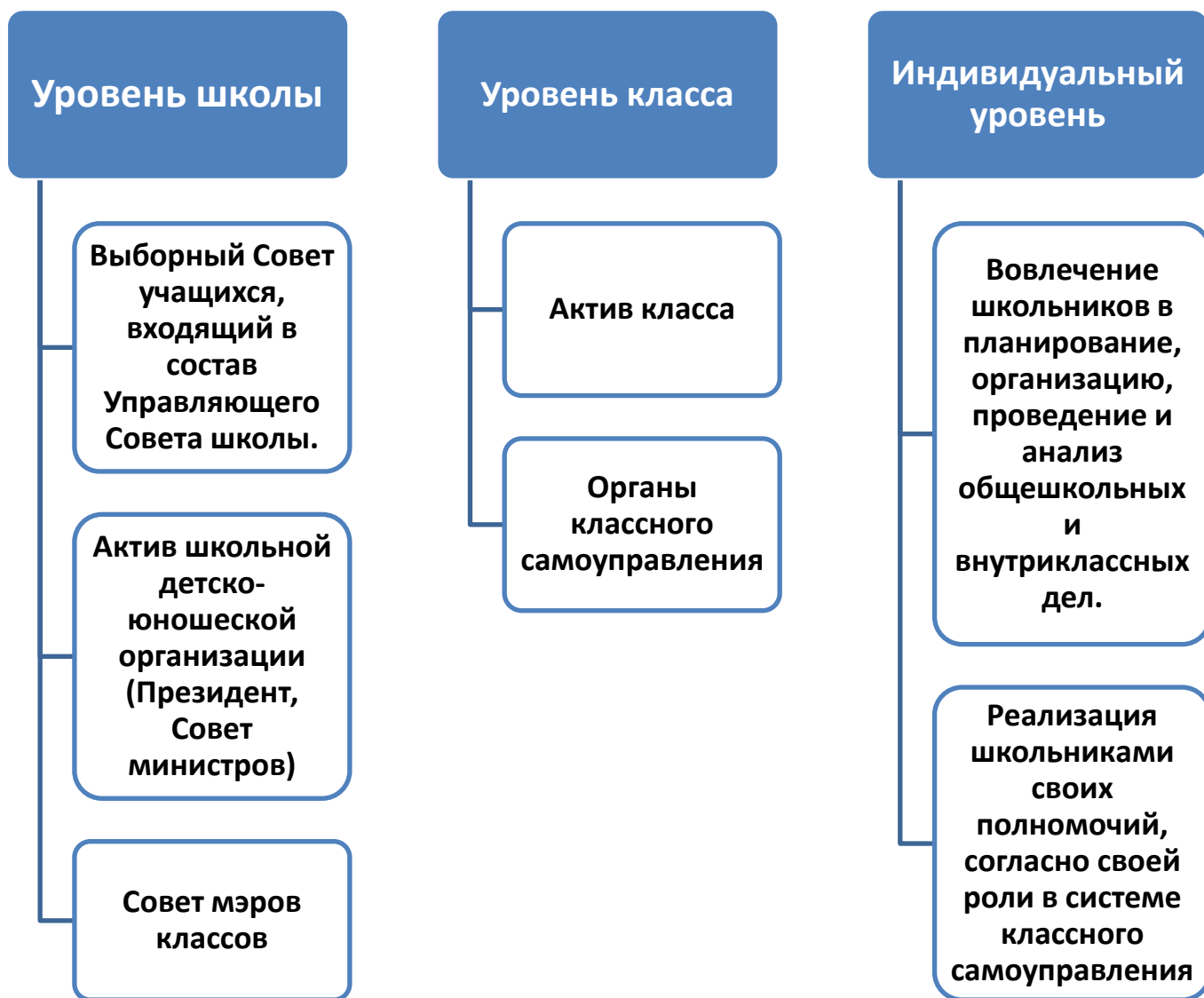
Схема 4. Реализация школьного самоуправления по уровням.