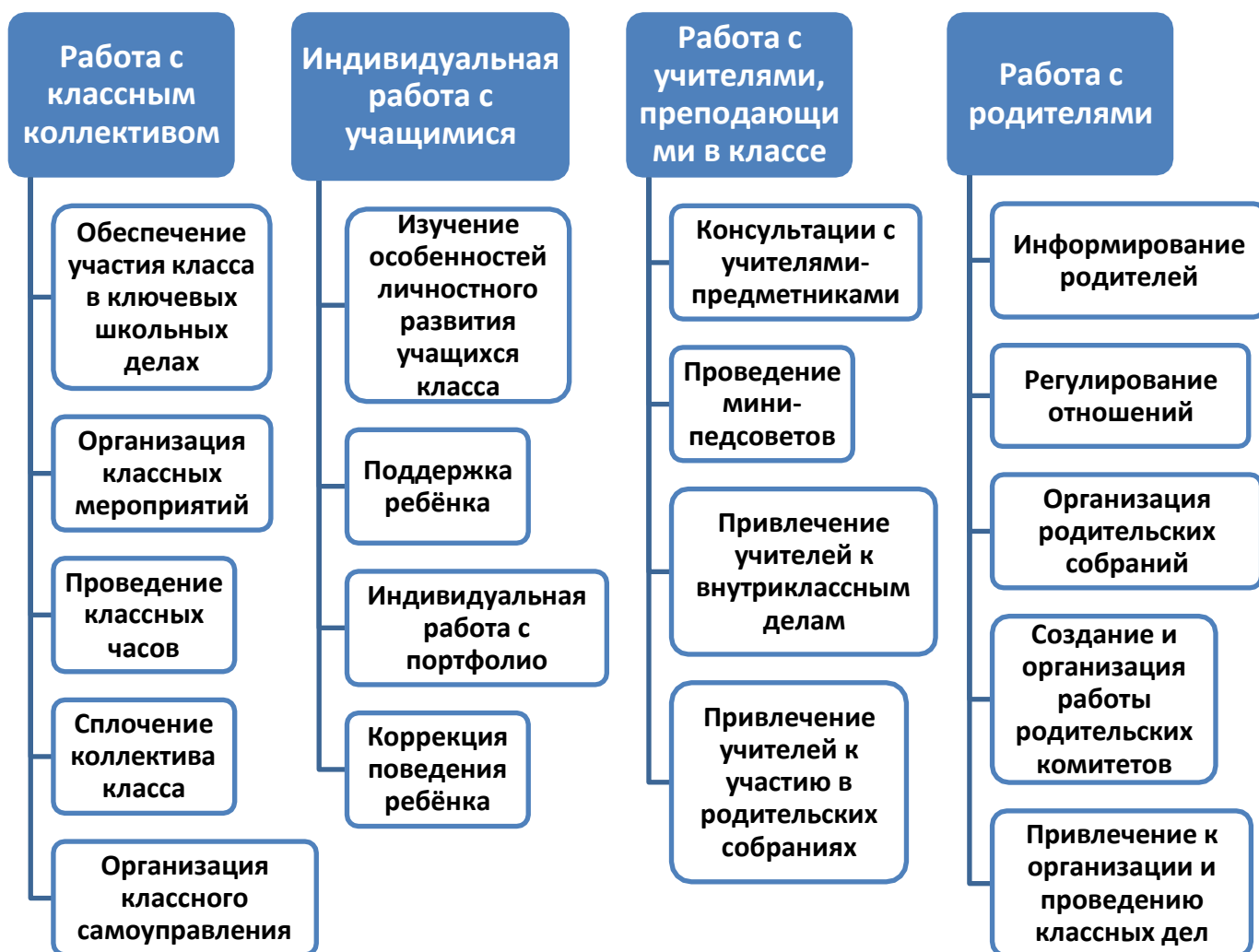
Схема 2. Классное руководство.

Осуществляя работу с классом, классный руководитель организует работу с коллективом класса; индивидуальную работу с учащимися вверенного ему класса; работу с учителями, преподающими в данном классе; работу с родителями учащихся или их законными представителями.