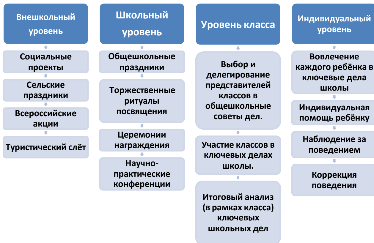
Схема 1. Школьные дела.